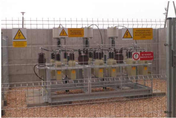
Bateria kondensatorów BKX U_n=15kV , Q=1200kVar , wyposażona w dławiki ograniczające i ograniczniki przepięć