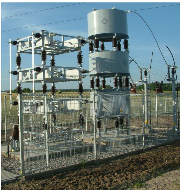
Bateria kondensatorów BKX U_n=30kV , Q=2100kVar , wyposażona w dławiki ochronne p=7\% i ograniczniki przepięć