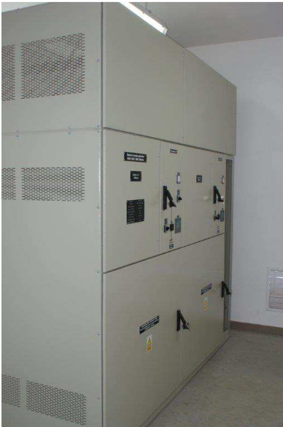
Bateria BKS U_n=10kV , Q=900kVar , człony 300kVar i 600kVar, wyposażona w dławiki ograniczające prądy łączeniowe, wkładki bezpiecznikowe SN i ograniczniki przepięć.